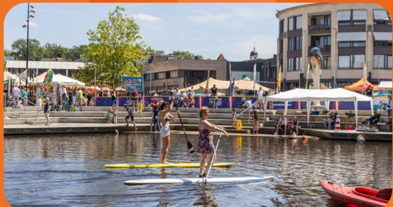
Almelo 24 - 30 juni 25.000 bezoekers