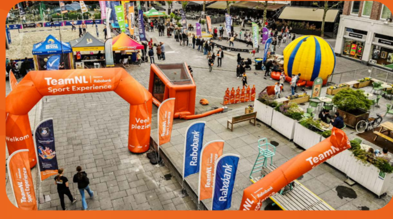
Heerlen 13 - 20 mei 4.000 bezoekers