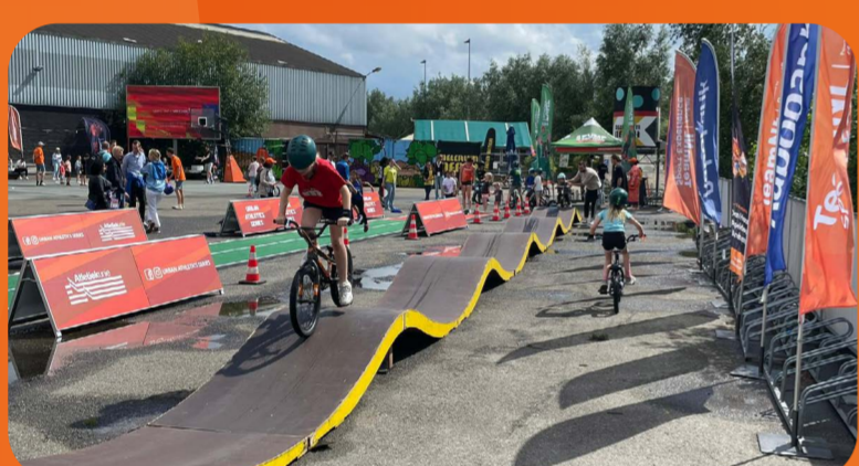
Breda 15 - 19 juli 2.500 bezoekers