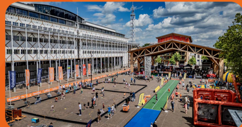
Apeldoorn 14 juli 4.000 bezoekers