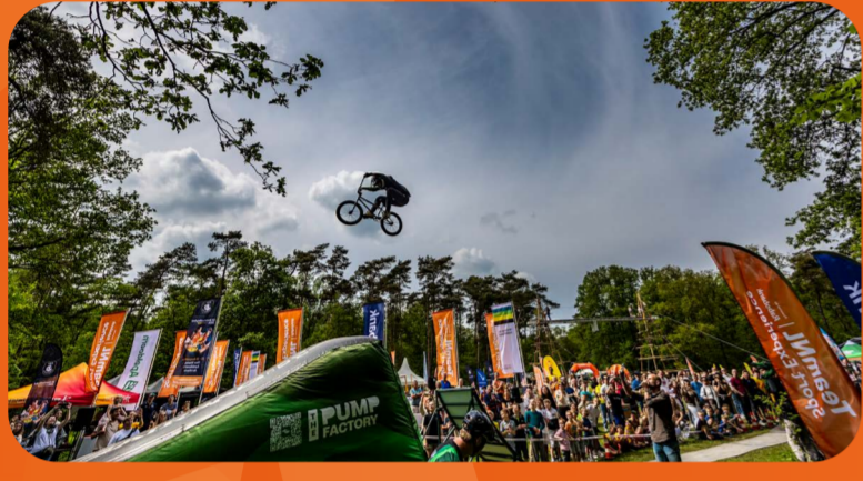
Apeldoorn 9 - 12 mei 27.000 bezoekers