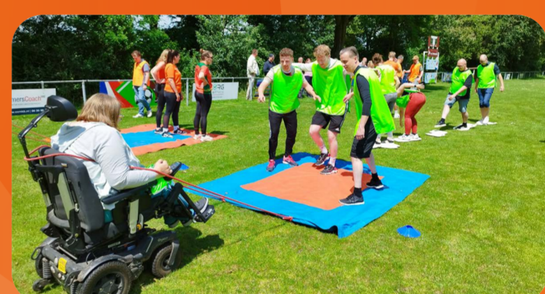
Gelderse Zeskamp 7 gemeenten 600 deelnemers