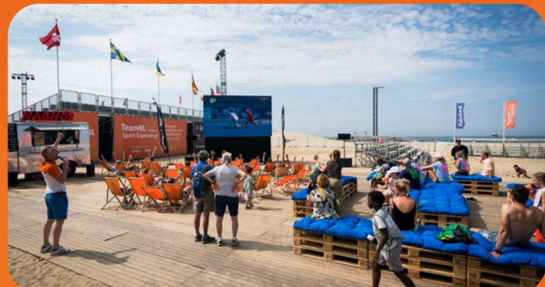
Den Haag 3 juli - 21 augustus 10.000 bezoekers